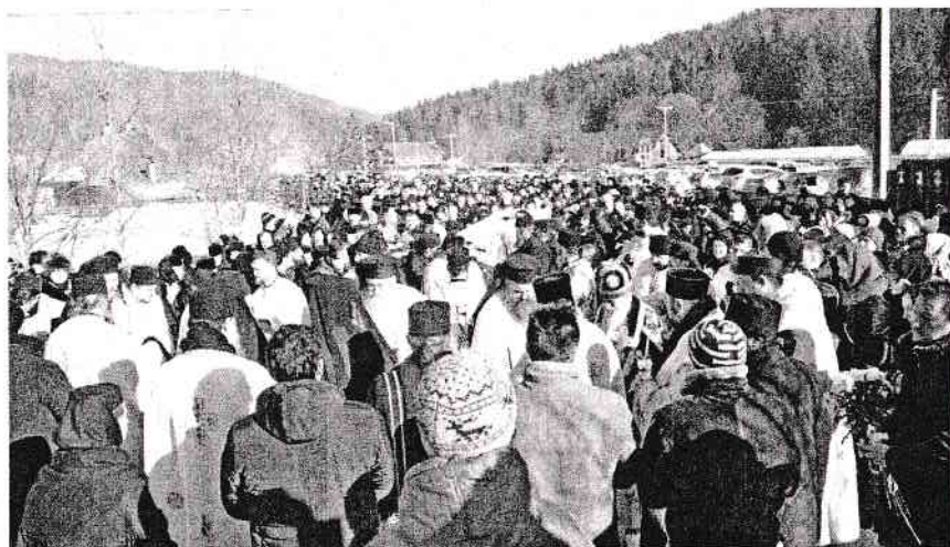
Înmormântarea Părintelui Proclu, 31 ianuarie 2017

Dumnezeu să-l ierte și în ceata dreptilor să-l așeze!